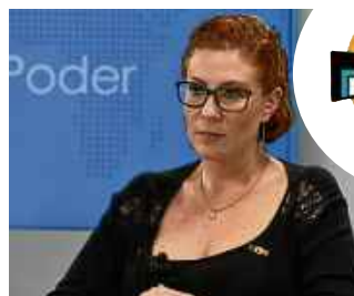
Marcelo Ferreira/CB/DA Press - 8/5/19

"Ditadura da toga? STF forma maioria para manter ordem de prisão de Zé Trovão. Foram 8 votos a ZERO contra seu HC. Enquanto isso, vândalos e terroristas de esquerda seguem destruindo patrimônio e instaurando o caos sob anuência e leniência de inimigos do Brasil"