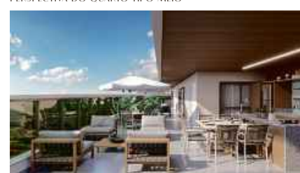
PERSPECTIVA DA CHURRASQUEIRA 01