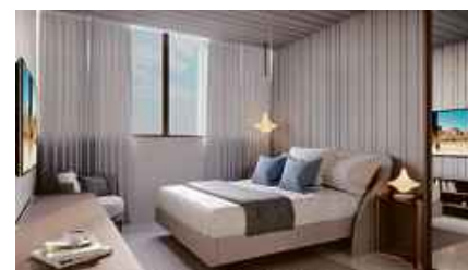
PERSPECTIVA DO QUARTO TIPO MEIO