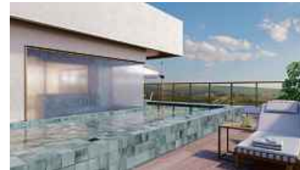
PERSPECTIVA DA PISCINA ADULTO