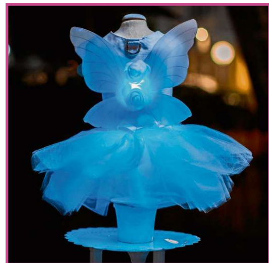
Vestido para cães com tecnologia de LED da nova coleção Conto de Fadas da marca Oh Dog