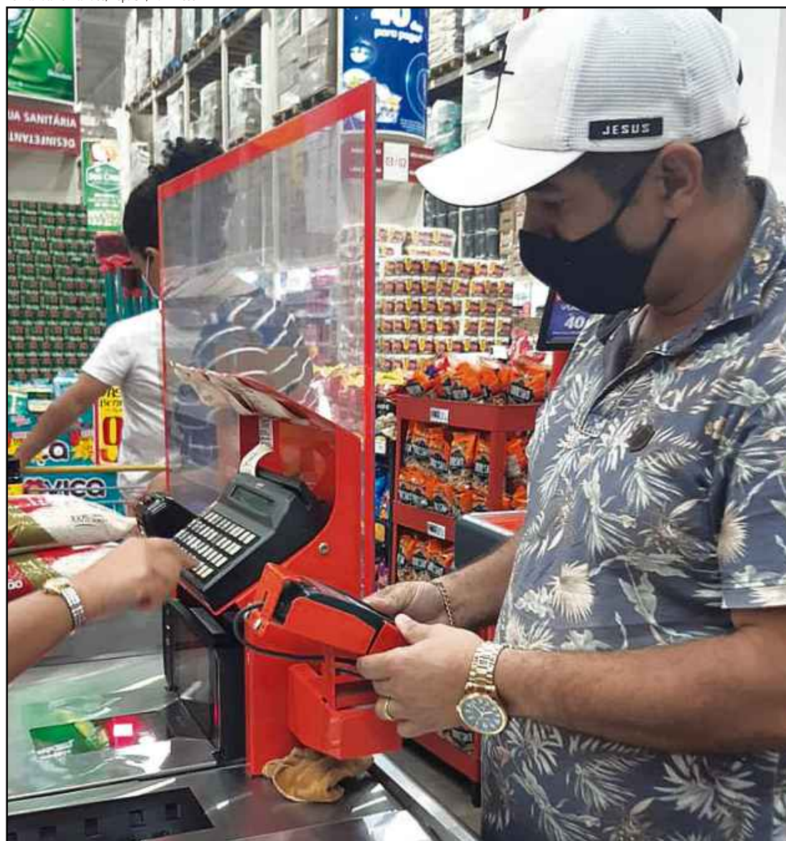
Cartão de crédito em ação no supermercado: para o consumidor, o risco é ver a dívida virar uma bola de neve