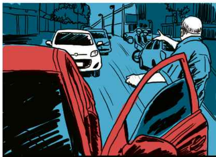
Briga no trânsito vira perseguição com atropelamento

Relembre casos que chamaram atenção pela violência excessiva e pela intolerância vistos durante a pandemia