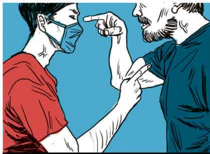
Morador se revolta com regras do flat onde mora

• Atitudes relacionadas às normas impostas durante a pandemia também podem gerar problemas. Em Curitiba, uma briga corporal entre o segurança de um supermercado e um cliente que tentava entrar no estabelecimento sem máscara terminou com a morte de uma funcionária do local. A mulher foi baleada após confusão entre os dois homens e morreu no local.