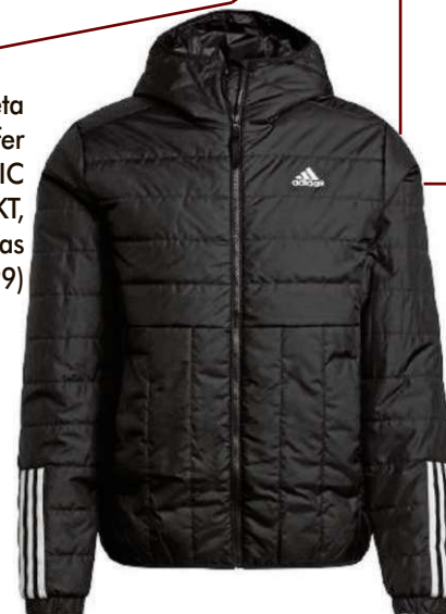
Jaqueta puffer ITAVIC L HO JKT, da Adidas (R$ 599,99)