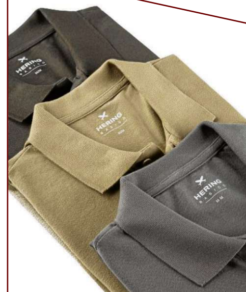
Camisas vendidas no Combo Hering (R$ 59,99 cada)

O cantor Samuel Rosa costuma combinar bem as camisas florais com jaquetas jeans. A proposta conversa até com o momento do palco. Para o stylist Oten, mesmo a peça sendo mais casual, pode ornar bem nas sobreposições de inverno e meia-estação e, por ser muito versátil, vale o investimento.