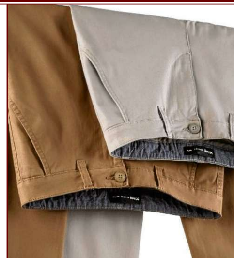
Calças chino, da Hering (R$ 119,99 cada)

Uma terceira peça despojada — jaqueta de couro, jeans ou no estilo puffer — são ideais para enriquecer o look. Combine-as com peças de corte reto para um visual moderno. A bolsa crossbody, que aparece nas duas composições, são práticas para guardar os objetos do dia a dia.