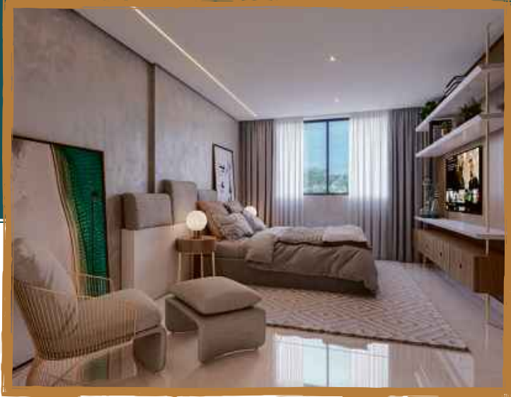
2º Ofício R.14 M.4589