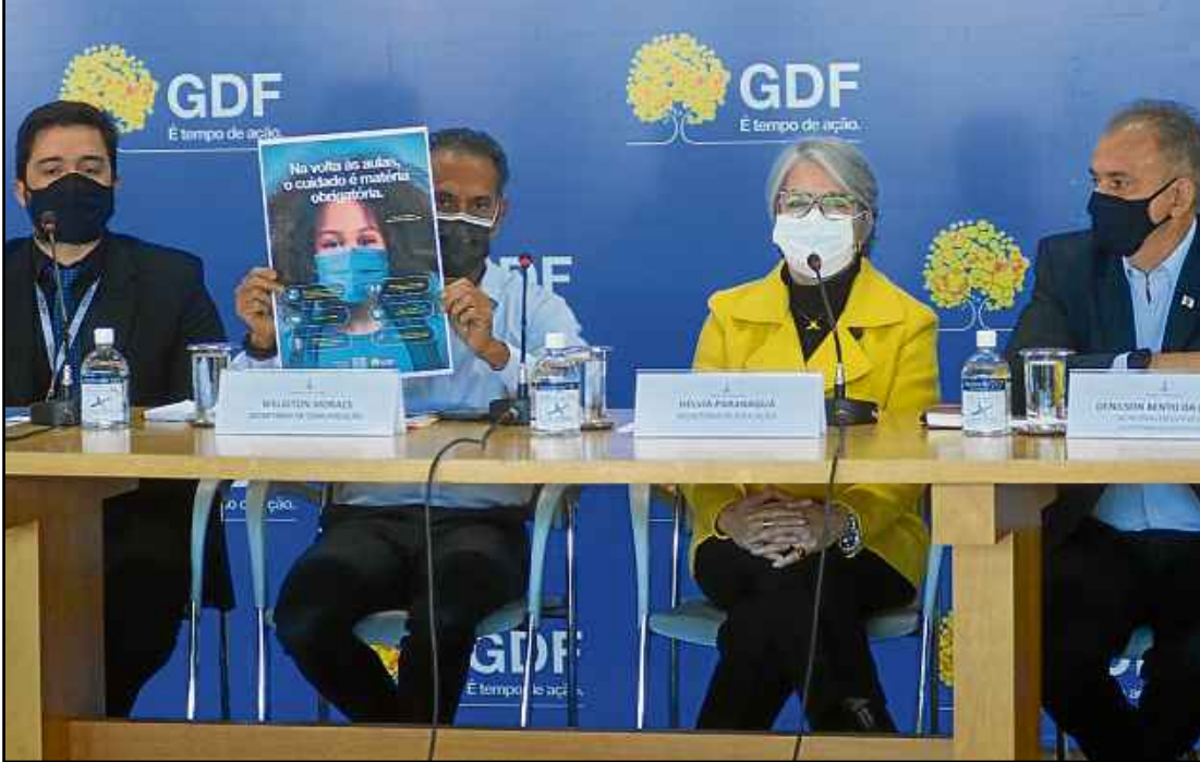
Plano de retomada às atividades presenciais foi divulgado, ontem, pela Secretaria de Educação do DF

essencial. "A escola é, acima de tudo, um espaço de socialização, convivência, aprendizagem coletiva e vivência. Então, os nossos estudantes precisam estar nesse ambiente, socializando com os colegas e aprendendo", reforçou. Segundo a chefe da pasta, para a tomada de decisão foram consultados Sindicato dos Professores no Distrito Federal (Sinpro-DF), administração e direção de escolas. "Foi uma construção coletiva,