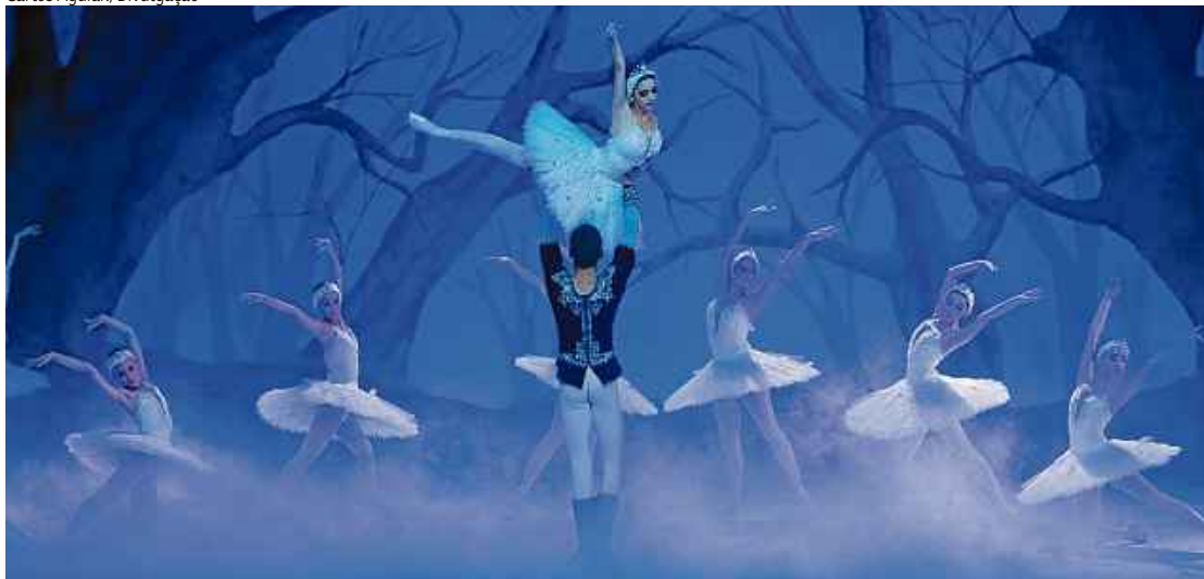
A montagem de O lago dos cisnes é feita 100% com bailarinos brasileiros

Wallace Martins/Esp. CB/D.A Press - 1/4/19