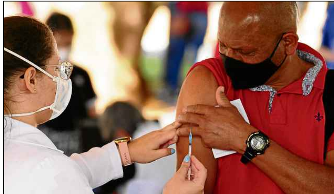
De acordo com a pesquisa CNT/MDA, eleitor enxerga culpa do presidente pelo ritmo devagar da vacinação

nas, disse que ele próprio não se vacinaria, o governo liderado por ele ignorou mais de 100 e-mails da Pfizer, declarou publicamente que não compraria a CoronaVac e também ignorou as primeiras propostas da mesma”, explicou.