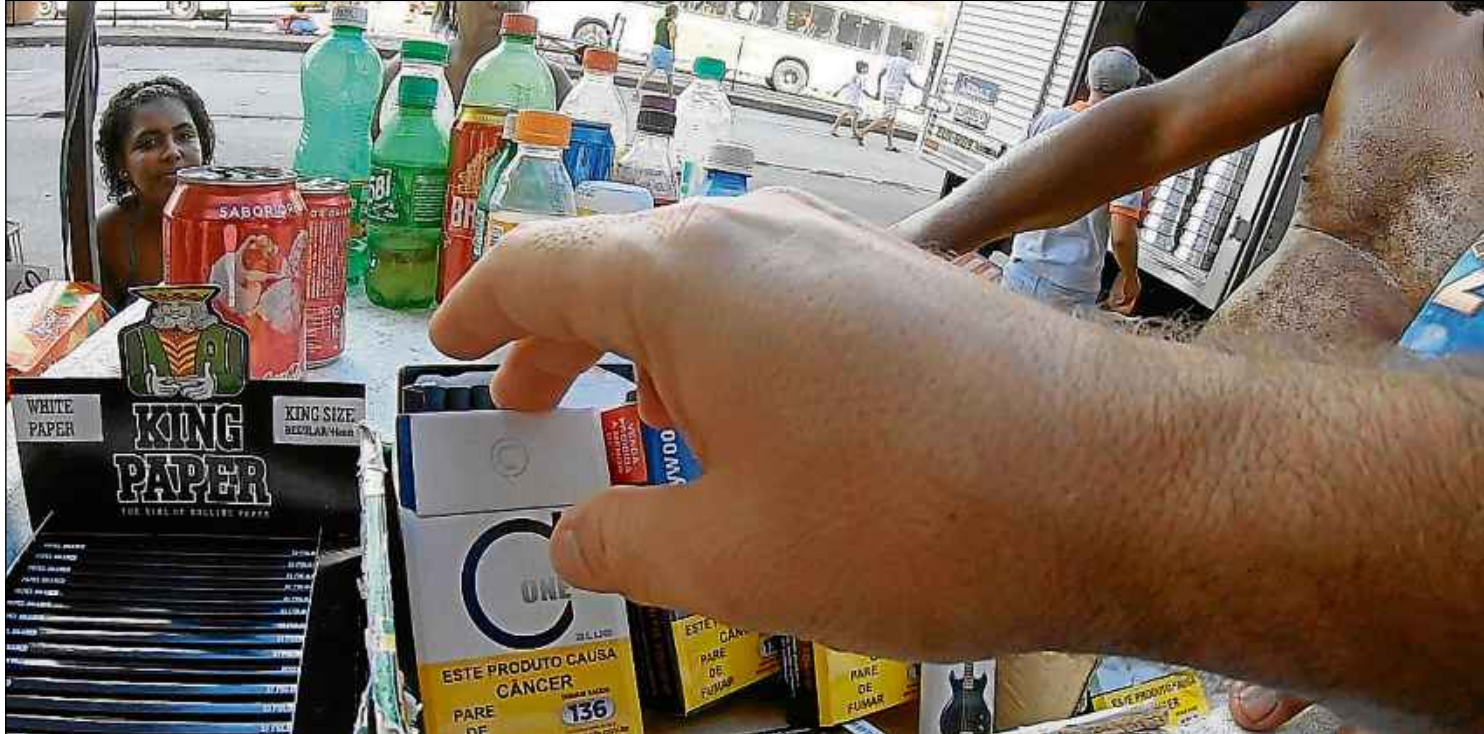
89% dos cigarros ilícitos são comprados no varejo formal e apenas 7% é encontrado em canais informais, como camelôs e marreteiros (Ibope/Ipec 2020)