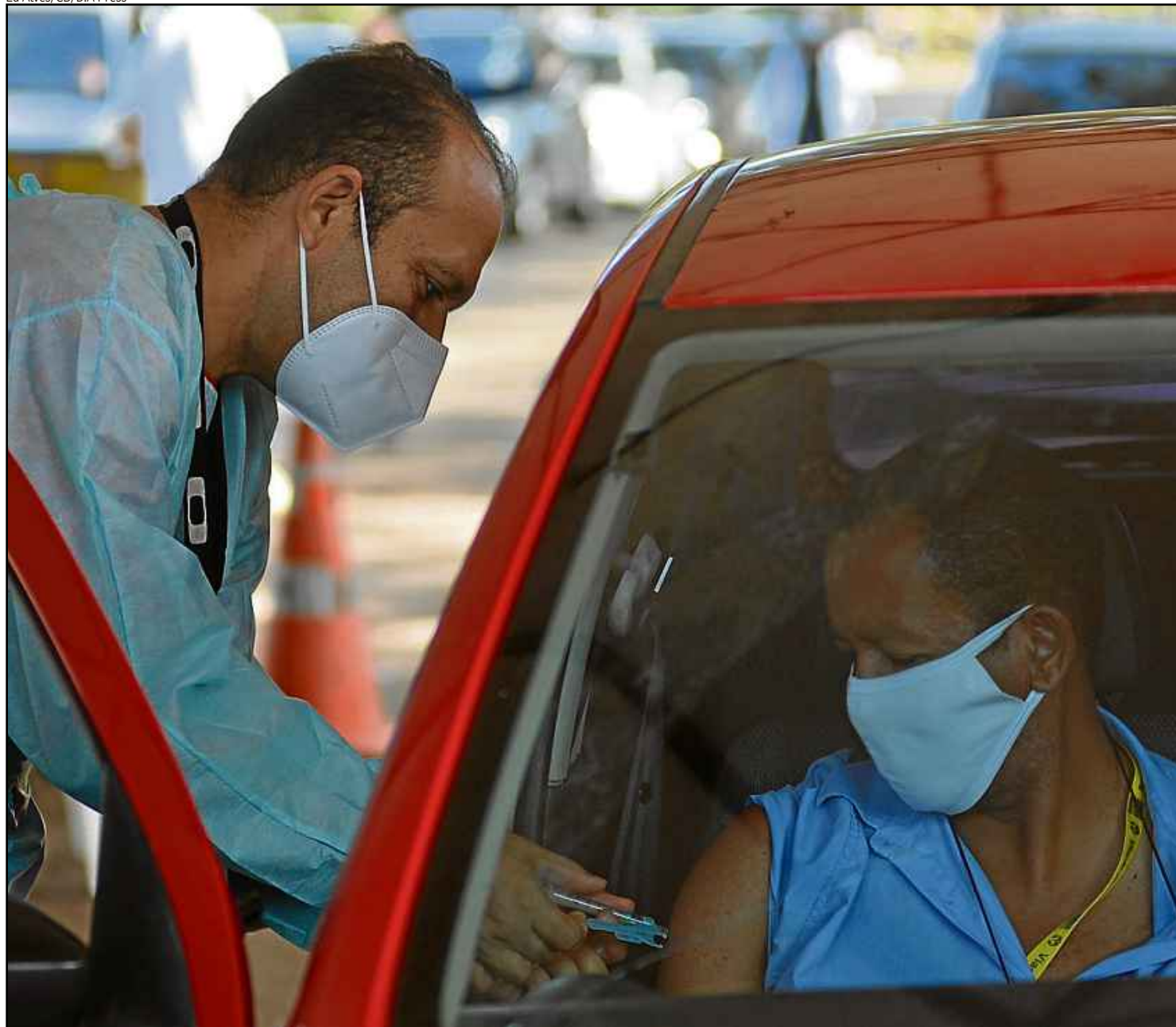
Além do drive-thru no Parque da Cidade, rodoviários podem se vacinar em Ceilândia, na unidade básica de saúde (UBS) 5, e no Riacho Fundo 1 (UBS 1)