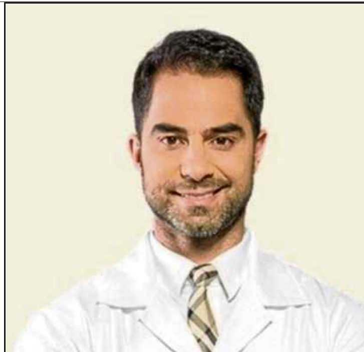
Médico foi preso após postar vídeo no qual ofende vendedora muçulmana

tringido o acesso ao perfil, que antes era público. O médico também postou um vídeo em que diz que “não suporta injustiça, pessoas que