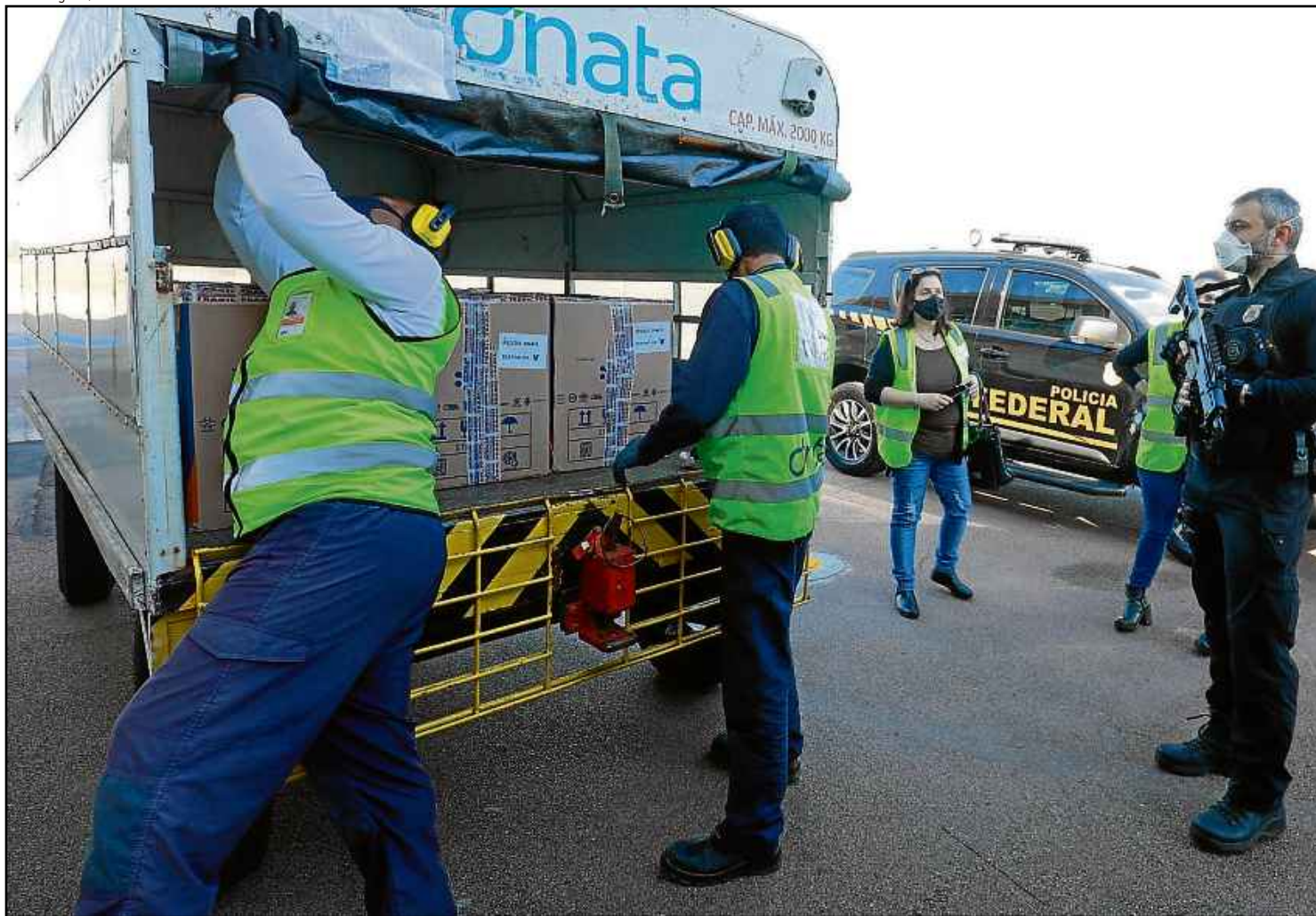
Chegada de 38.610 doses da Pfizer/BioNTech a Porto Alegre. Segundo o ministério, 3,5 milhões de unidades da vacina já foram distribuídas no país

tologia da Universidade Estadual Paulista (Unesp) e consultor sobre covid da Sociedade Brasileira de Infectologia (SBI) e da Associação Médica Brasileira (AMB), afirma não ser possível apontar quando o país terá a maioria da população vacinada.