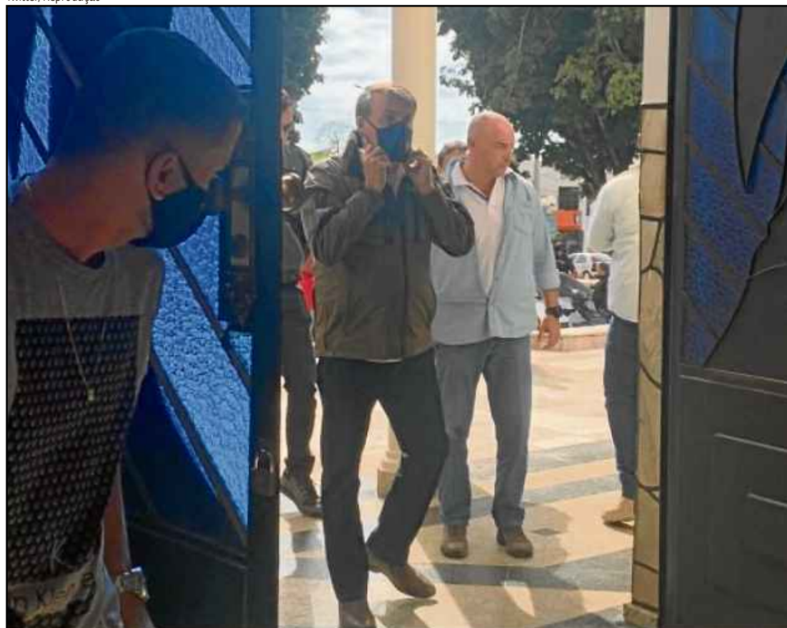
Bolsonaro participou de missa, em Formosa, com máscara, mas causou aglomeração