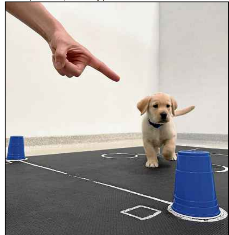
Um dos filhotes testados pelos cientistas da Universidade do Arizona