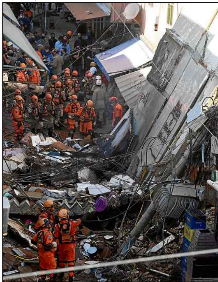
Bombeiros buscam vítimas após desabamento na madrugada de ontem