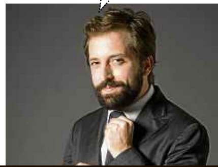
Fabio Seixo/Divulgação - 19/3/19

Acompanhe a cobertura da política local com @anacampos_cb