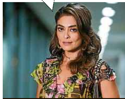
Raquel Cunha/Divulgação - 23/2/17

Se o comandante do Exército não consegue punir um general, as instituições estão realmente funcionando?