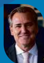
Alexis Fonteyne Deputado Federal (NOVO-SP)