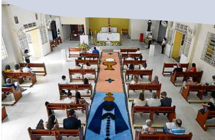
Tapete que prepara o caminho de Cristo, feito pela Paróquia Santa Rita de Cássia, no Lago Sul