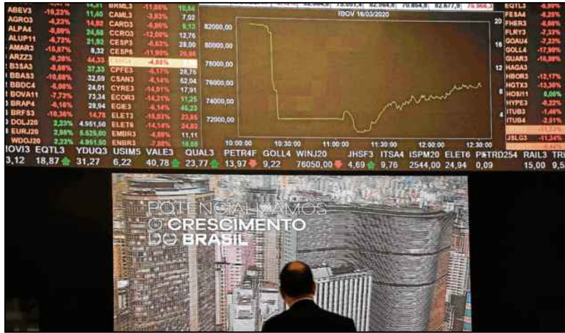
Agentes do mercado recalcularam a pontuação da B3 neste ano. Estimam que pode chegar aos 150 mil pontos