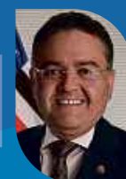
Roberto Rocha Senador (PSDB-MA)