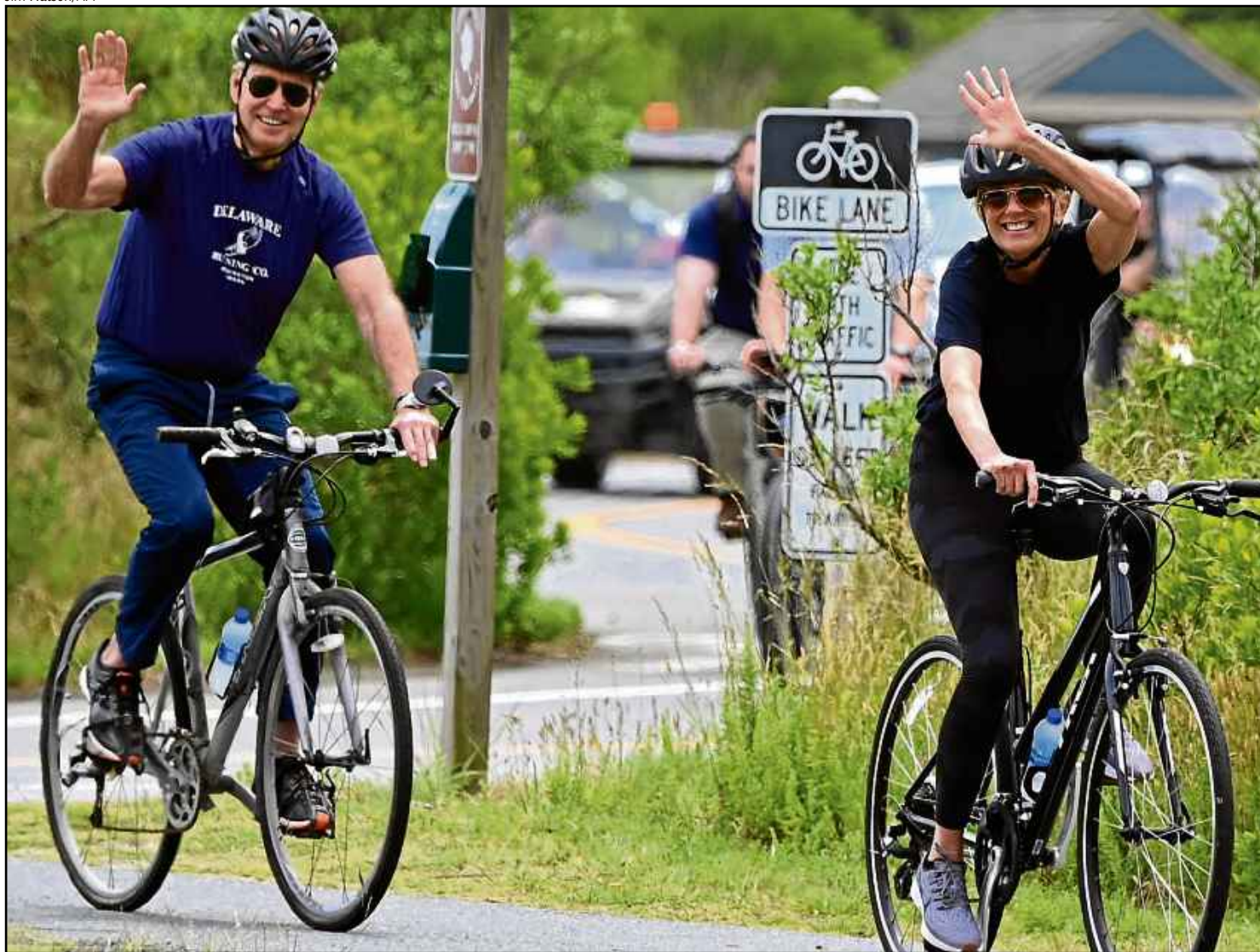
Joe Biden (E) e a primeira-dama, Jill, passeiam de bicicleta no Parque Estadual de Cape Henlopen, em Lewes (Delaware): avanços contra a pandemia