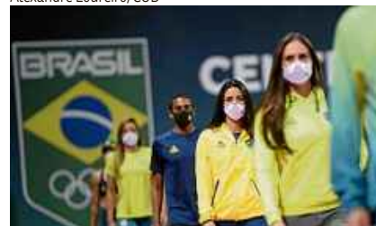
TÓQUIO - O Comitê Olímpico do Brasil exibiu, ontem, os uniformes da delegação para o evento no Japão, a partir de 23 de julho.