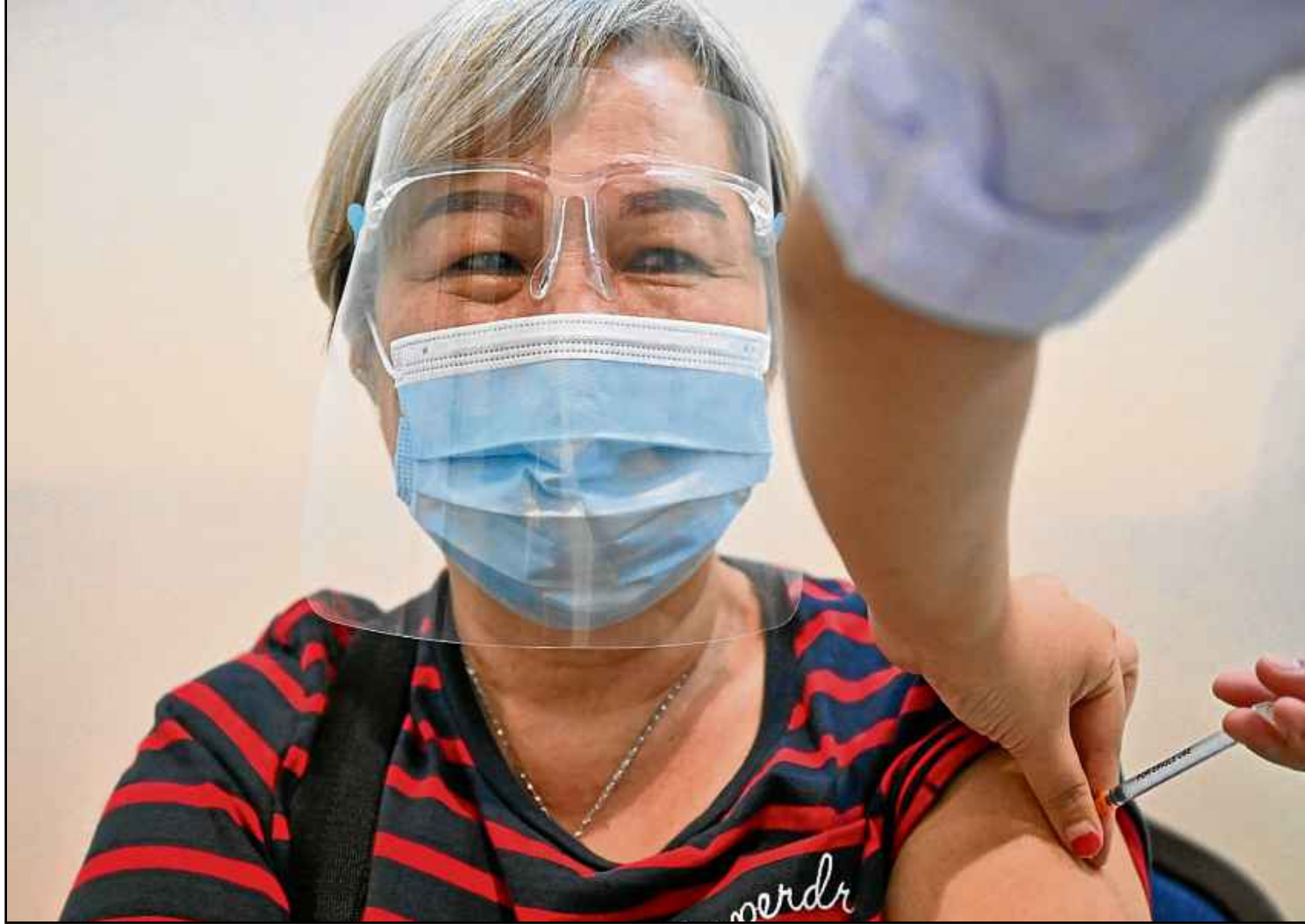
Médica aplica dose do imunizante da Pfizer/BioNTech em idosa da Malásia, durante megacampanha de vacinação em Kuala Lumpur

riante dominante na Europa durante a primeira onda, em abril de 2020, chamada de D614G; a variante descoberta pela primeira vez em Kent, no Reino Unido (Alpha); a cepa que surgiu inicialmente na África do Sul (Beta); e a mais nova variante de “preocupação”, descoberta pela primeira vez na Índia (Delta).