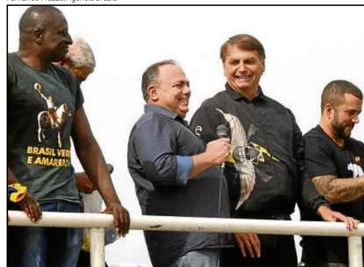
Pazuello no ato político a favor de Bolsonaro, em 23 de maio, no Rio