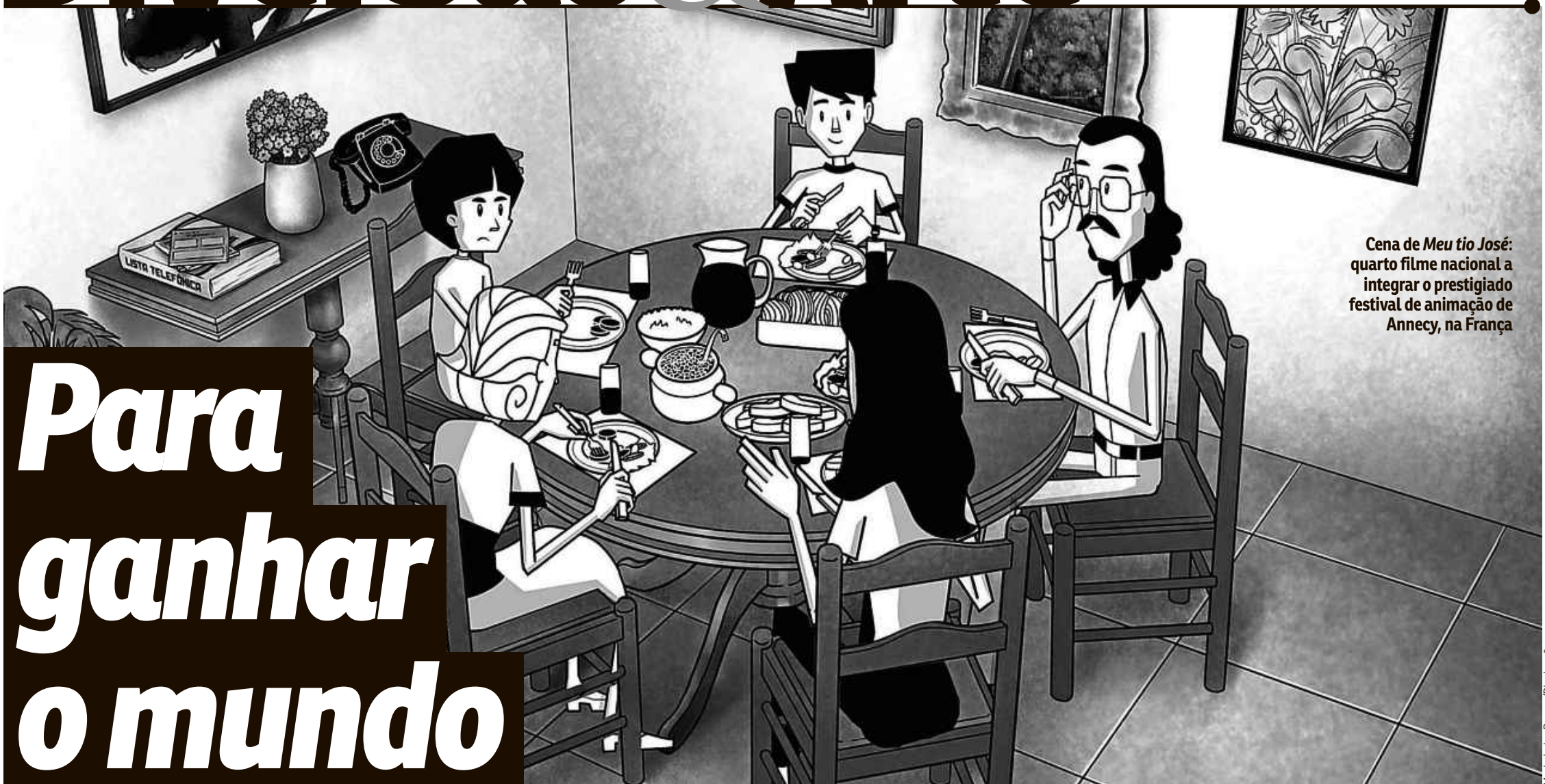
Cena de Meu tio José : quarto filme nacional a integrar o prestigiado festival de animação de Annecy, na França