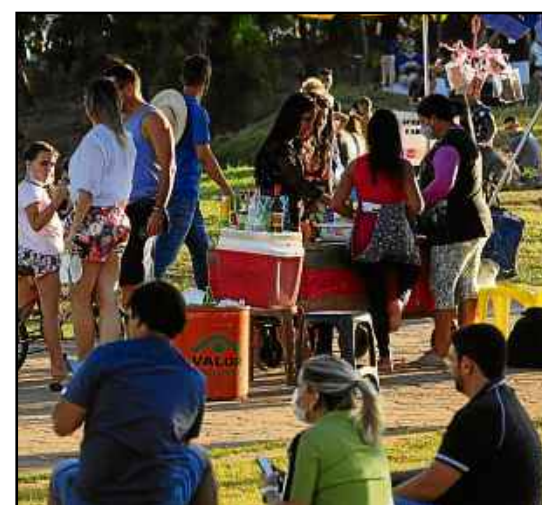
Pessoas se aglomeraram na Orla da Ponte JK durante o dia de Corpus Christi. Muitos estavam sem máscaras

No DF, o uso de máscaras é obrigatório até que a pandemia de covid-19 esteja controlada, conforme Decreto 40.831/20. O descumprimento da regra pode gerar multa de R$ 2 mil a R$ 4 mil. Segundo a Secretaria de Saúde, o uso do acessório diminui as