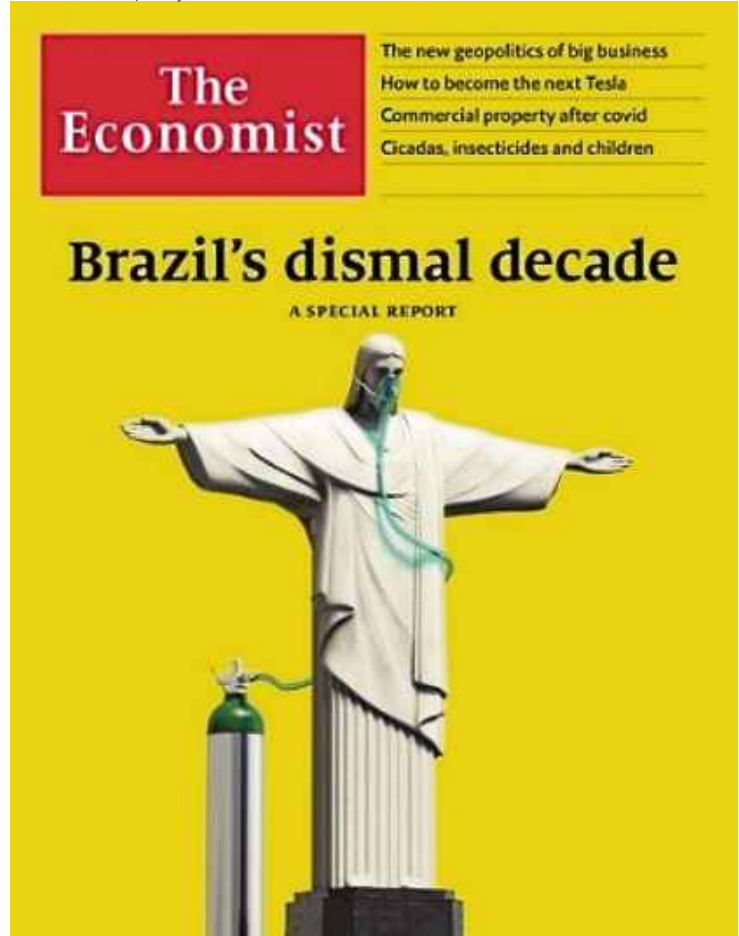
Pessimismo da publicação está explícita na capa e no título da edição