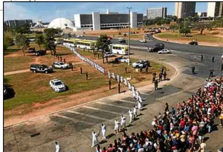
Foram liberados 1.858 detentos, sendo que 1.139 são do CPP, no SIA

controle diário de fiscalização residencial, a fim de manter a ordem, segurança e total cumprimento à legislação de execução penal.