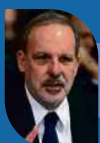
Armando Monteiro Conselheiro Emérito da Confederação Nacional da Indústria (CNI)