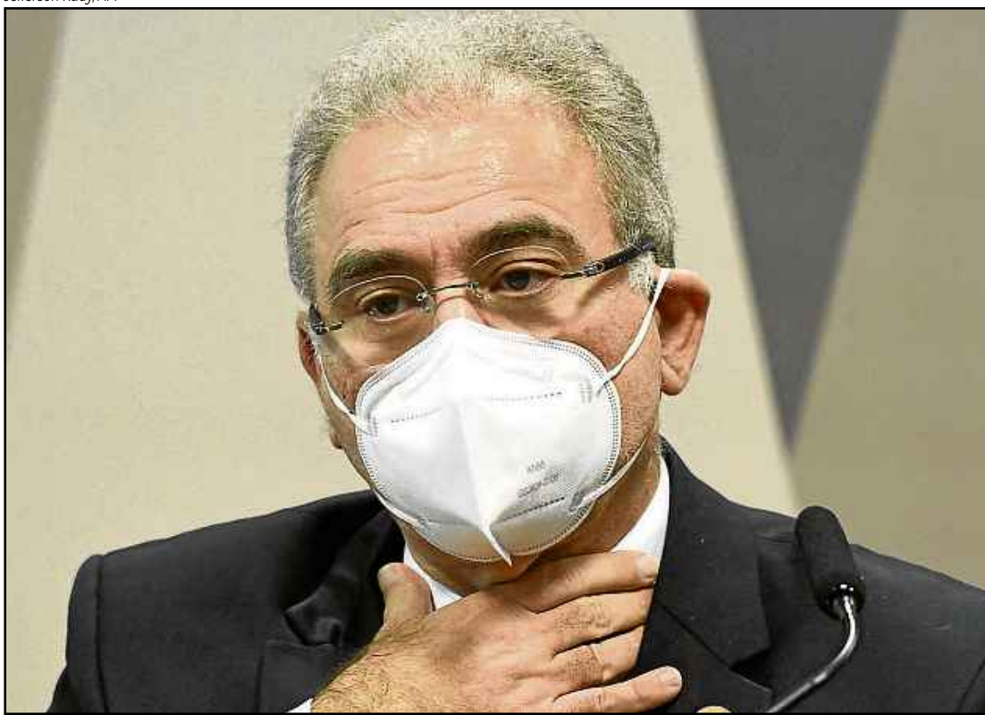
O ministro da Saúde, Marcelo Queiroga, será ouvido novamente pelos senadores na próxima terça-feira