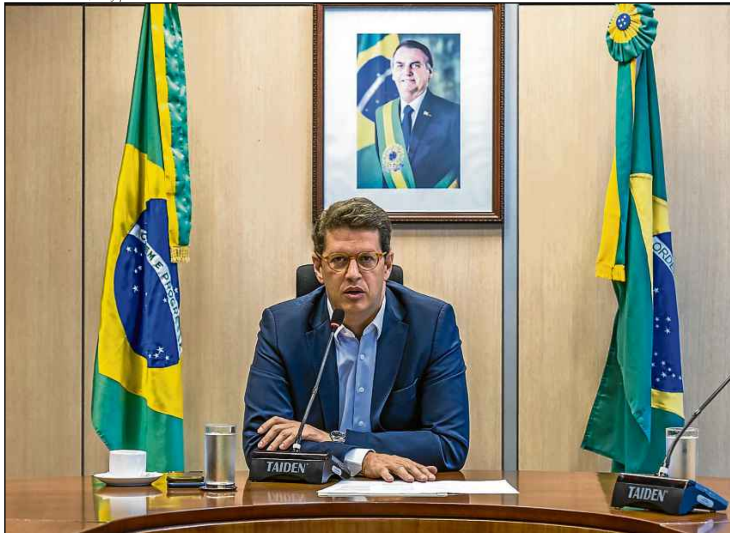
O ministro do Meio Ambiente, Ricardo Salles, é suspeito de obstrução de investigação ambiental, advocacia administrativa e organização criminosa