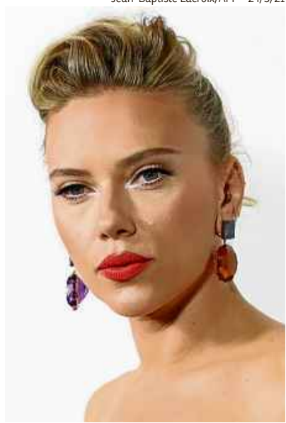
Scarlett Johansson: críticas às posições sexistas da HFPA

Assim, no começo de maio, a HFPA anunciou mudanças no corpo de membros, com a intenção de somar imediatamente 20 novos integrantes não brancos. Porém, a mudança ainda teria de ser aprovada por todos os participantes da associação. Então, a emissora NBC, que exibe a premiação desde 1996, anunciou que não transmitirá a cerimônia do Globo de Ouro no ano que vem. Em comunicado, a NBC declarou ter esperança de exibir a cerimônia da premiação em 2023, mas apenas supondo que a organização executará as mudanças necessá-