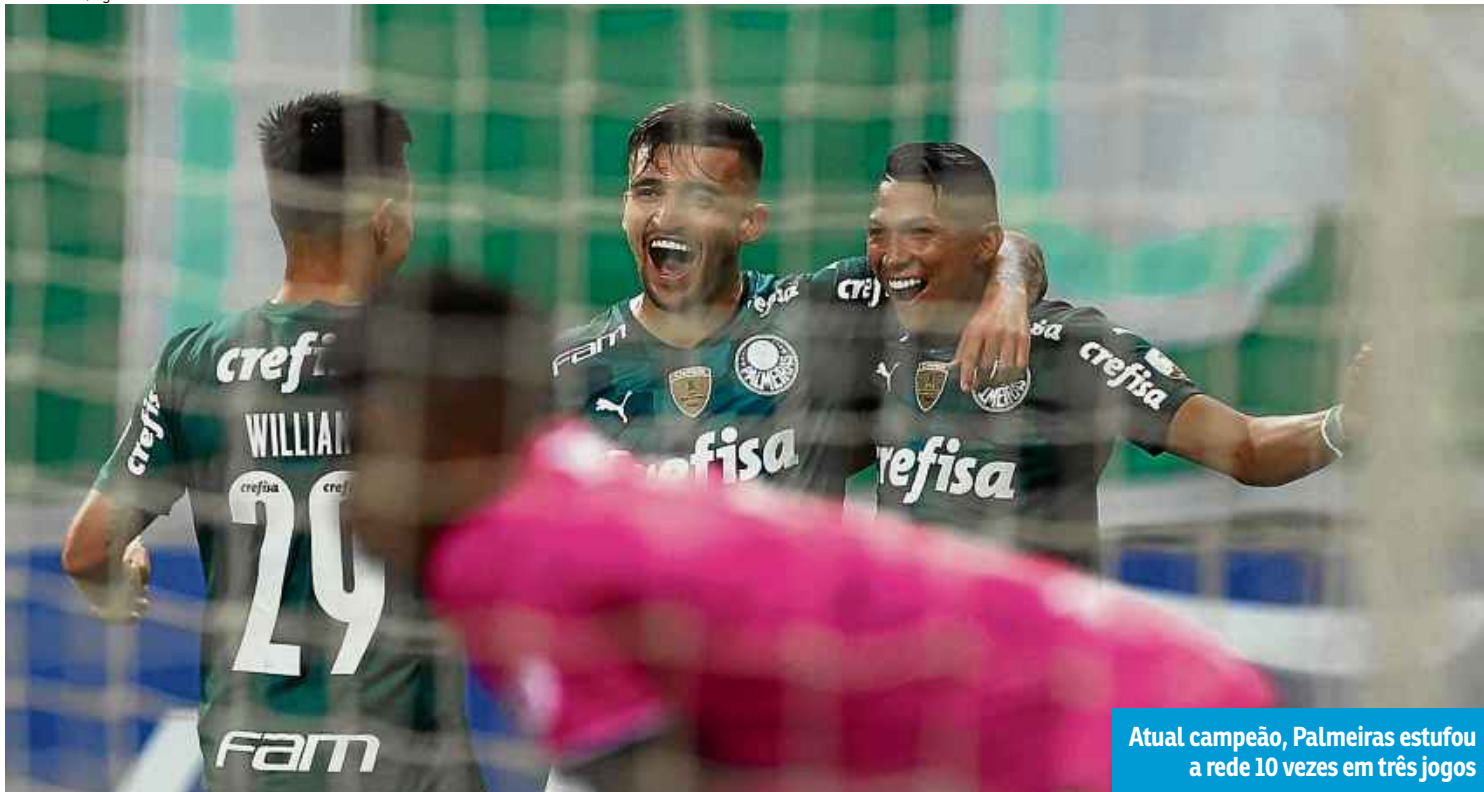
Atual campeão, Palmeiras estufou a rede 10 vezes em três jogos