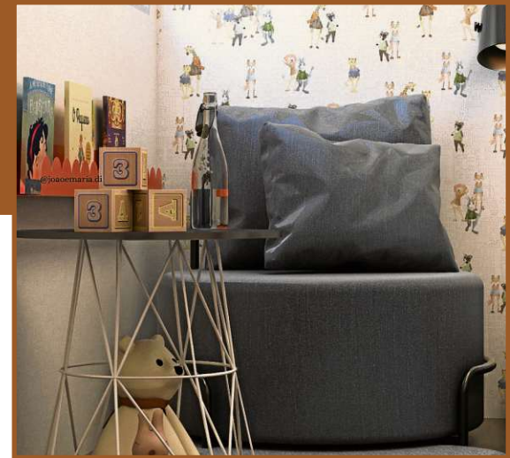
A designer de interiores Ericka Sales optou por exaltar o lado lúdico neste espaço