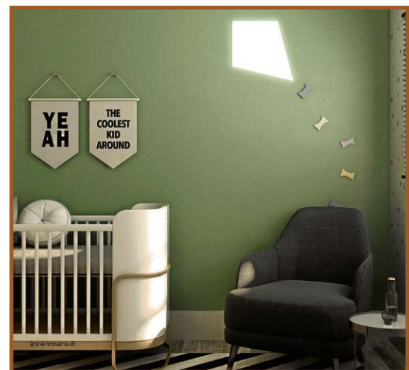
Simplicidade, tranquilidade e aconchego devem ser pensados na hora de criar o cantinho da amamentação. Projeto de Ericka Sales

uma meia-luz, bem baixinha, para não incomodar ou acordá-lo, e também não deixar ninguém muito agitado. Pois, além do bebê, a mãe estará sonolenta quando for amamentar.”