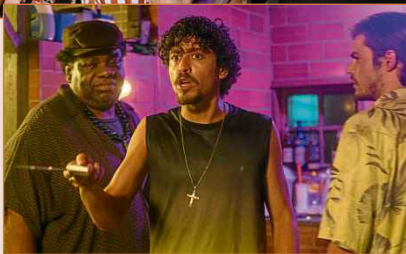
Cenas de O auto da boa mentira : o humor em tempos de rede social

“Acho a comédia o gênero mais difícil que existe. Esse filme partiu da inusitada ideia de se basear em palestras do Ariano, e gostei da estrutura, que tem algo das comédias italianas episódicas dos anos de 1970. Não é tão regional (de fonte do Nordeste) quanto poderia se esperar, é urbano. E trata de alguns momen-