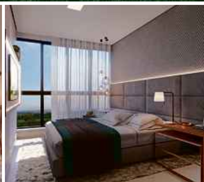
Perspectiva da suite - apto 2 quartos