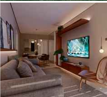
Perspectiva do living - apto 2 quartos