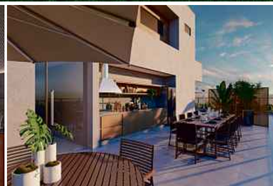
Perspectiva do terraço e churrasqueira 2 - cob. leste