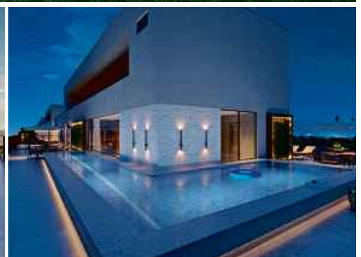
Perspectiva da piscina adulto- cobertura oeste