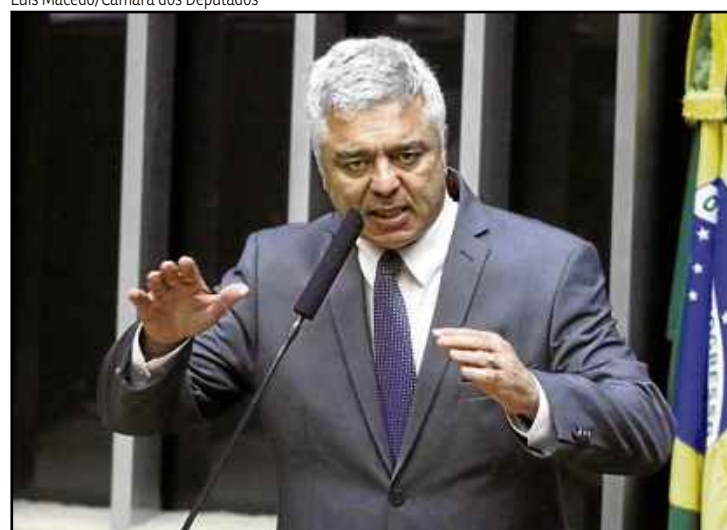
Major Olímpio: “O governo está perdido em termos de economia”

mou o vice-líder da legenda, em referência aos presidentes do Senado e da Câmara, respectivamente. Para ele, os equívocos no combate às crises econômica e sanitária já passaram do limite para um país democrático. “Se a