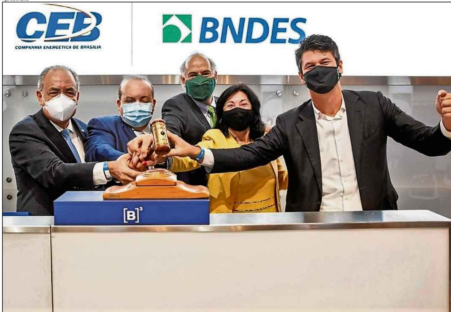
Leilão para venda de 100% das ações da distribuidora ocorreu em 4 de dezembro, na Bolsa de Valores de São Paulo (B3), mas Tribunal de Justiça do DF havia suspenso a alienação