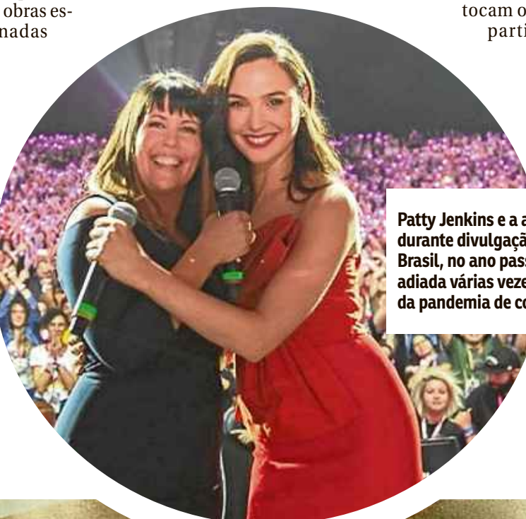
Patty Jenkins e a atriz Gal Gadot durante divulgação do filme no Brasil, no ano passado: estreia adiada várias vezes por causa da pandemia de covid-19