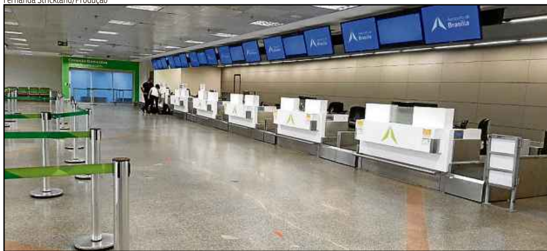
Aeroporto JK após decretação do isolamento social. Ação contra covid-19 atingiu fortemente transporte aéreo

tivo, enquanto Serviços Prestados às Famílias (4,6%) atingiu a terceira alta seguida. Porém, no ano, acumulam retração de 8,5% e de 37,7%, respectivamente.