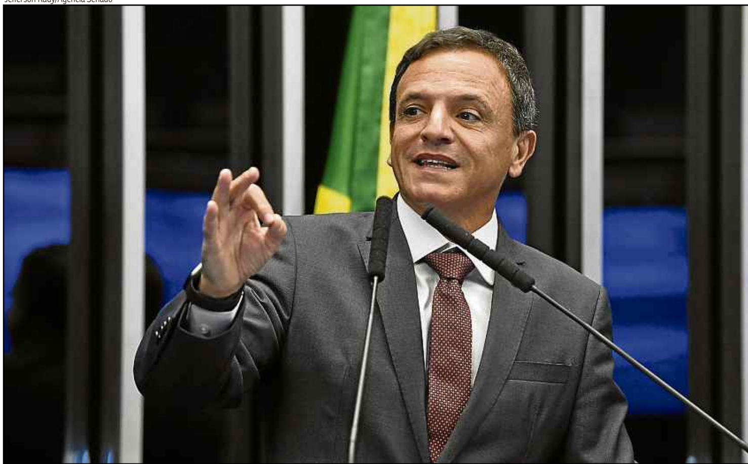
O senador Marcio Bittar alegou como motivo para o adiamento a “complexidade das medidas e da atual conjuntura do país”

benefícios sociais, como o abono salarial. Após o comandante do Planalto vetar o nome Renda Brasil, Bittar propôs incluir o novo programa social na PEC Emergencial, sob o nome de Renda Cidadã. Mas, a proposta do senador de financiar o benefício por meio do adiamento do pagamento de precatórios não foi bem-aceita pelo mercado, por configurar calote de decisões judiciais. Desde então, o senador não apresentou nenhuma nova proposta para o programa, e o governo voltou a cogitar a manutenção do Bolsa Família, mas “ampliado”, incluindo beneficiários do auxílio emergencial, que deixará de ser pago a partir de 31 de dezembro.