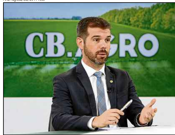
Para Lucchi, qualidade do produto brasileiro supera questão ideológica