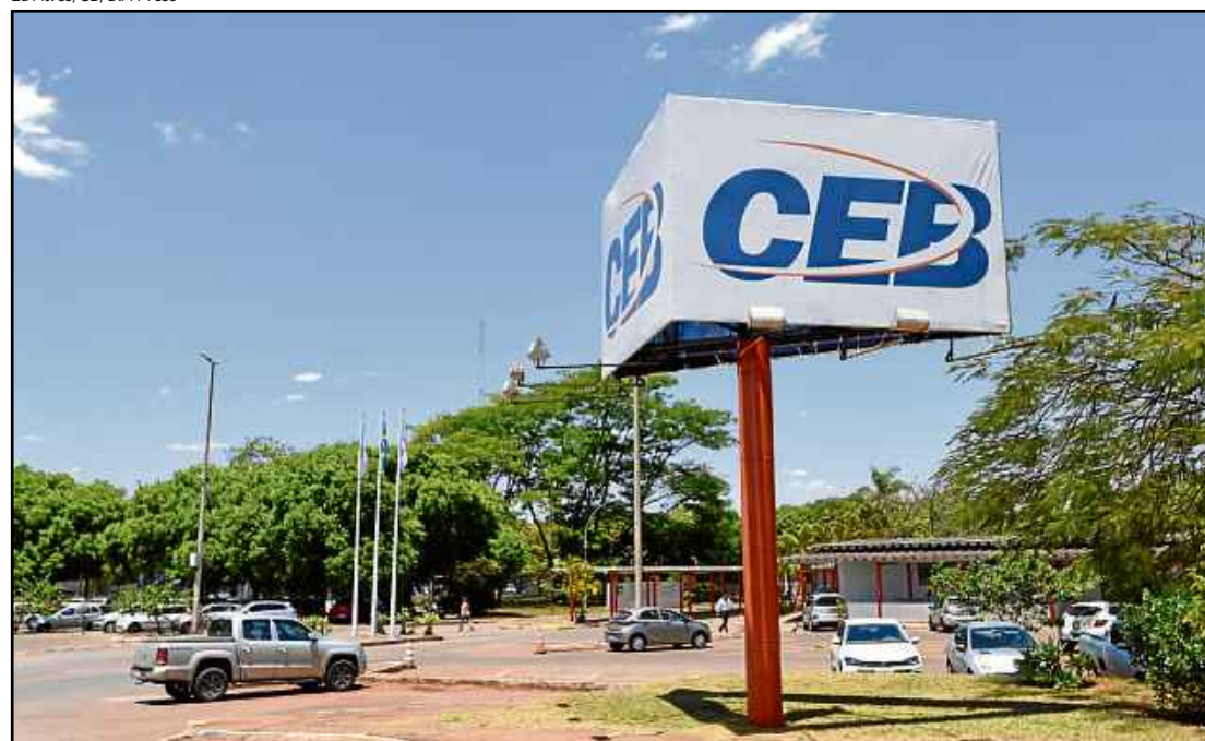
Ministro do STJ argumenta que deliberação da assembleia extraordinária da CEB recebeu aval de tribunais