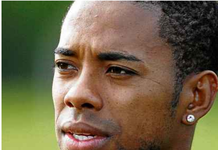
Grampeado, Robinho teve novas escutas telefônicas divulgadas ontem

Brasil, pelo menos tu não fica em cana (risos)", comentou o atacante com um amigo, cujo nome foi suprimido. "Se os caras mandarem eu ir lá depor, vai ser foda, vou falar o que pra minha nega? Vou lá depor pra quê? Oito caras rangaram a mina... Ó que fase que eu tô", teria dito o atacante em outra parte da conversa.