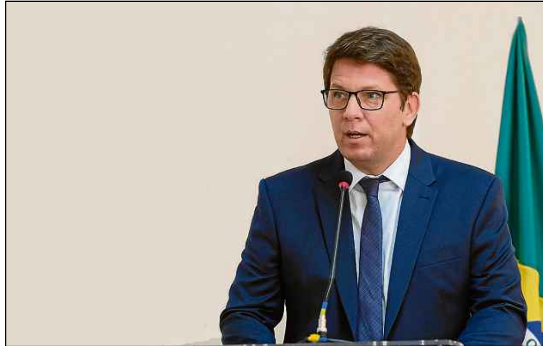
O secretário-especial da Cultura foi submetido a um cateterismo e teve colocados dois stents

que possa retomar, em breve, suas atividades”, escreveu.