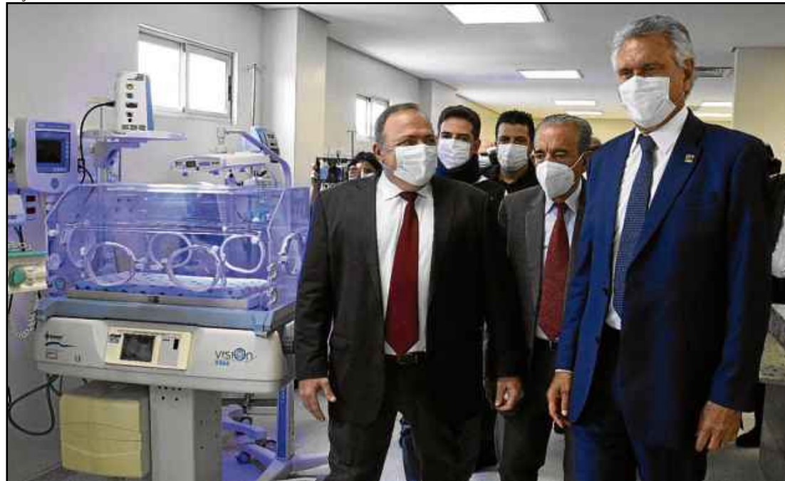
Pazuello e Caiado na inauguração da maternidade. Governador disse que MP é reação à "politicagem"